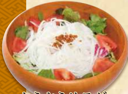
さらさらサラダ 960円(税込1,036円)