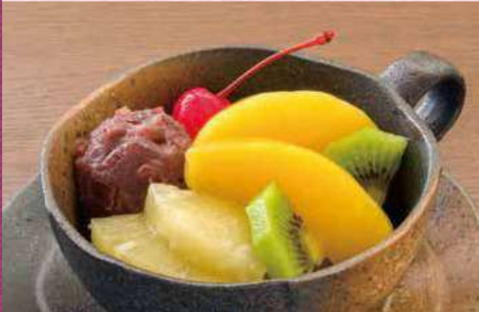
あんみつ 320円 (税込345円)