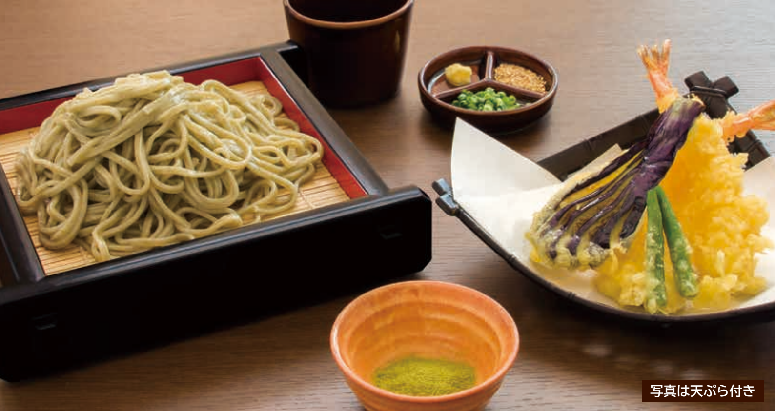
写真は天ぷら付き