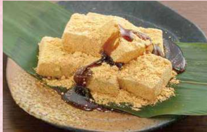
自家製わらび餅 350円 (税込378円)