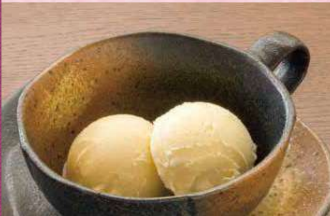
バニラアイスクリーム 150円 (税込162円)