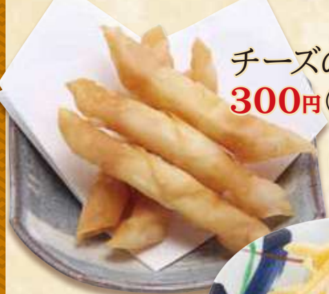
チーズの包み揚げ 300円(税込324円)