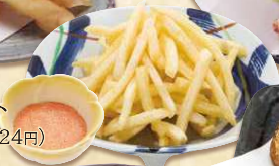
明太ポテト 300円(税込324円)