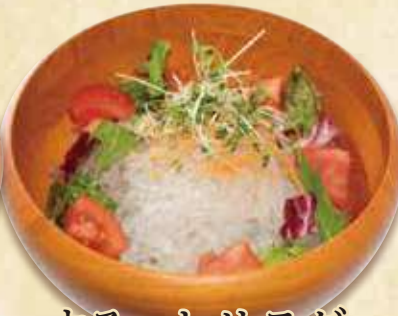
するっとサラダ 980円(税込1,058円)