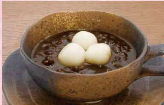
白玉ぜんざい 330円 (税込356円)