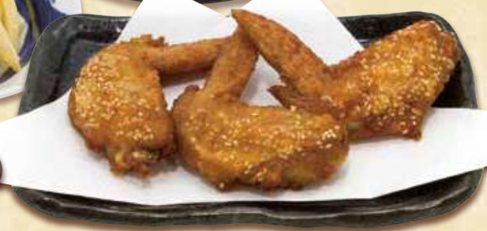
ごま手羽揚げ(3本) 520円(税込561円) 1本追加ごとに プラス160円(税込172円)