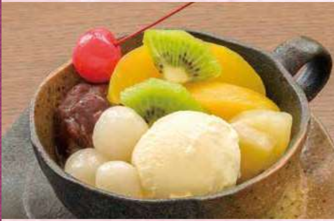
白玉あんみつ 380円 (税込410円)