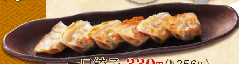
一口餃子 330円(税込356円)