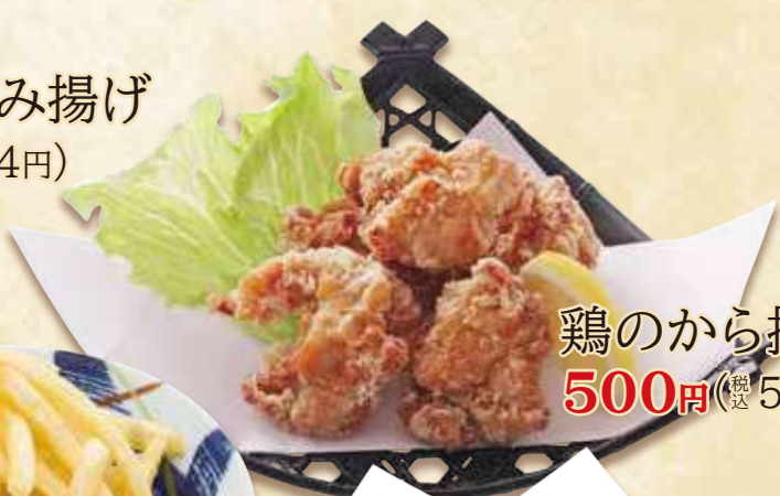
鶏のから揚げ 500円(税込540円)